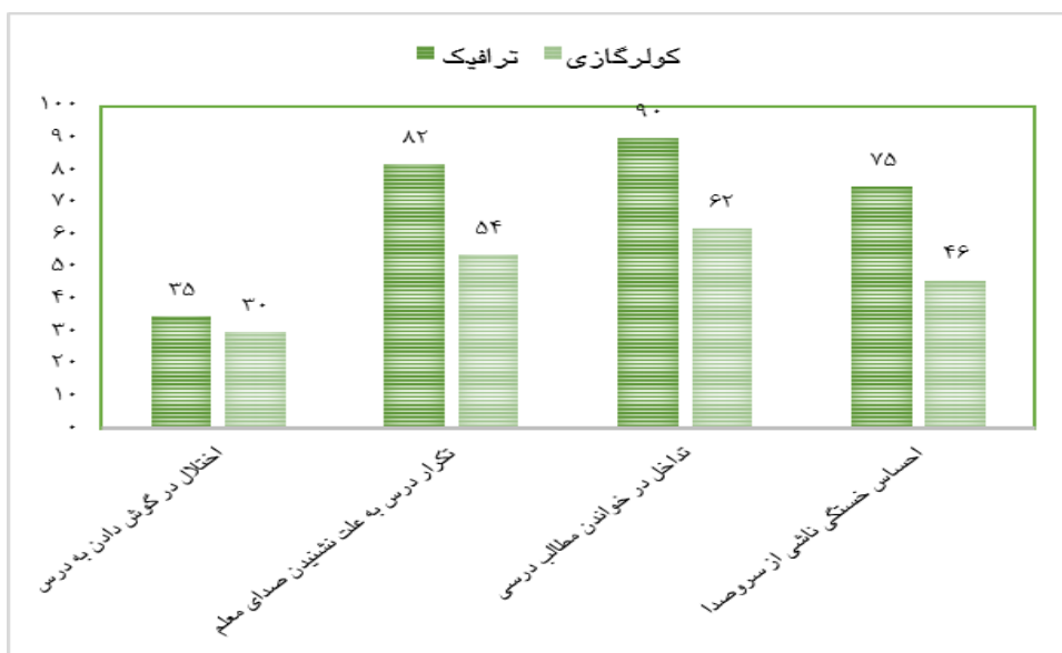
نمودار ۲- مشکلات ناشی از سروصدای ترافیک و کولرگازی در فرایند آموزش دانش آموزان

محیط آموزشی رنج می‌برند. این بدین معناست که سروصدا آرامش روانی و تمرکز دانش آموزان را در محیط آموزشی دچار اختلال می‌کند (۸،۱۷). دانش آموزان در محیط آرام با دقت بیشتر کلمات و مطالب را یاد می‌گیرند و سروصدا باعث کاهش دقت، فهم و حافظه آن‌ها می‌شود. در مطالعات دیگر نیز نشان داده شده است که سروصدا در فرایند آموزش و یادگیری دانش آموزان تأثیرگذار است و از طرف دیگر رابطه معنی‌داری بین در معرض سروصدا قرار گرفتن و دقت در امتحانات ریاضی و زبان به اثبات رسیده است (۱۲،۱۴،۱۸،۱۹). لذا علاوه