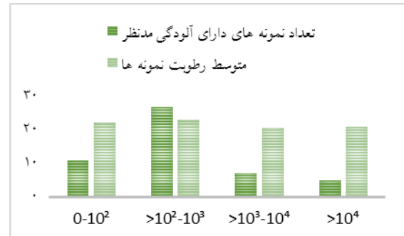
نمودار ۳- توزیع فراوانی میزان آلودگی نمونه‌های نان به کپک و متوسط رطوبت نمونه‌ها

متوسط رطوبت تمام نمونه‌های نان نیز برابر 22/4 درصد بود. همچنین مشخص گردید که از ۵۰ نمونه نان، میزان آلودگی به کپک در ۲۷ نمونه در محدوده CFU/g 10^2 تا CFU/g 10^2 بود.