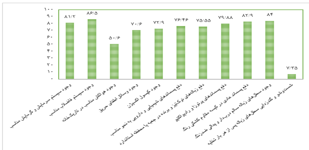
نمودار ۲- میانگین نمرات مراکز رادیولوژی از نظر شاخص تأسیسات و ایمنی

همچنین نمودار ۲ نشان می‌دهد در شاخص تأسیسات و ایمنی گویه وجود سیستم فاضلاب مناسب در واحدها بیشترین درصد (۸۶/۵) و گویه شست‌وشو و