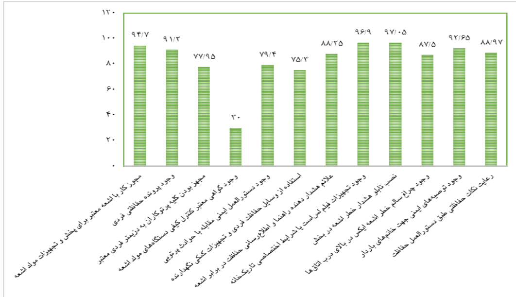
نمودار ۳- میانگین نمرات مراکز رادیولوژی از نظر شاخص حفاظت در برابر اشعه

همان‌گونه که نمودار ۳ نشان می‌دهد شاخص حفاظت در برابر اشعه گویه نصب تابلو هشداردهنده اشعه در بخش بیشترین درصد (۹۷/۰۵) و گویه وجود گواهی معتبر کنترل کیفی