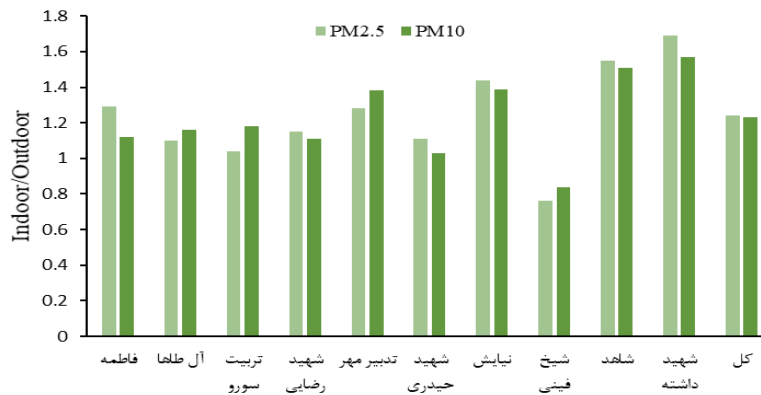
نمودار ۲- نسبت غلظت ذرات در هوای داخل به هوای بیرون مدارس

r بین غلظت PM2.5 داخل و خارج مدارس و غلظت PM10 داخل و خارج مدارس به ترتیب برابر 0/478 و 0/512 و مقادیر P-Value در هردو شرایط کمتر از 0/05 بود.