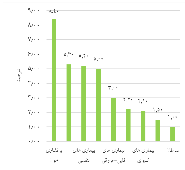
نمودار ۱- توزیع فراوانی بیماری های زمینه ای در مبتلایان به کووید-۱۹

کووید-۱۹، اکثریت شرکت کنندگان (۳۵/۲ درصد) این بیماری را خطرناک می دانستند (نمودار ۲).