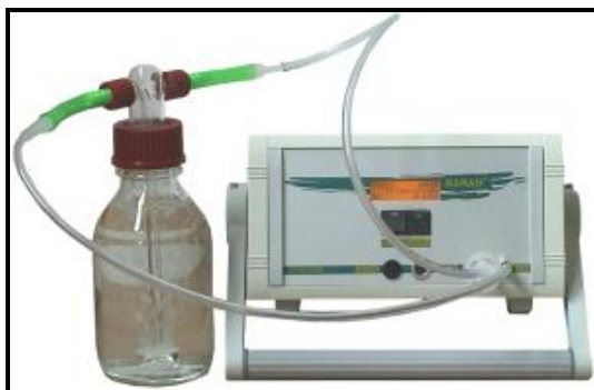
شکل شماره ۲- اندازه‌گیری غلظت رادن ۲۲۲ توسط دستگاه رادن سنج مدل RTM1688-2

با توجه به تأثیر دما بر میزان انتشار رادن ۲۲۲ از آب، قبل از اندازه‌گیری دمای تمام نمونه‌ها یکسان و به ۱۲°C رسانده شد (۲۷، ۲۸). اندازه‌گیری غلظت رادن ۲۲۲ توسط دستگاه رادن ۲۲۲ سنج مدل RTM1688-2 ساخت شرکت Sarad کشور آلمان مورد انجام شد (شکل شماره ۲). حساسیت این دستگاه در ۱۵۰ دقیقه اندازه‌گیری مداوم 6/5 \text{ Counts/min} \times \text{KBqm}^{-3} می‌باشد (۲۹). حساسیت بالا به همراه آنالیز طیف سنجی آلفا، منجر به زمان پاسخ‌دهی کوتاه حتی در غلظت‌های پایین می‌شود. اندازه‌گیری غلظت رادن ۲۲۲ نمونه‌های آب طبق دستورالعمل اندازه‌گیری ارئه شده توسط شرکت Sarad انجام شد. همچنین میانگین ۲ ساعته غلظت رادن ۲۲۲ برای همه نمونه‌ها ثبت و مورد آنالیز قرار گرفت (۳۰).